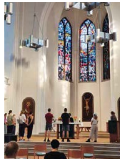
^ Vorbereitung für das weltwärts-Jahr 2020/21: leider vergeblich.

Im weltwärts-Freiwilligenprogramm kooperiert die Gossner Mission zum einen mit Brot für die Welt (beim Entsende-Land Sambia), zum anderen mit dem Berliner Missionswerk (bei den Einsatzstellen in Indien und Uganda).