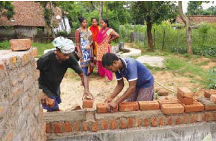
^ Der Bau schreitet voran: Martha-Kindergarten in Govindpur.