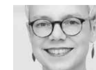
Jutta Klimmt hat den bewegenden (Abschieds-)Tag in Bad Salzuflen für die Gossner Mission festgehalten.