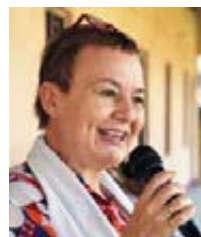
^ Ulrike Trautwein freut sich auf die Zusammenarbeit mit den Berlin-Brandenburger Indien-FreundInnen.

INDIEN-NETZWERK. Frischer Schwung für die Begegnungen mit Indien: Die Berliner Regionalbischöfin Ulrike Trautwein steht dem neu gegründeten Indien-Netzwerk in der EKBO vor. „Indien hat mich schon immer fasziniert“, lächelt sie. „Zum einen wurde meine Mutter in Südindien geboren, und zum anderen war ich bei meinem Besuch der indischen Gossner Kirche im Herbst 2019 sehr beeindruckt davon, wie sich die Christinnen und Christen in dem hinduistischen Umfeld behaupten und sich gegenseitig stärken.“ Das Indien-Netzwerk im Berliner Raum versteht sich als Plattform für vielfältige Initiativen und gemeinsame Aktivitäten mit der indischen Gossner Kirche.